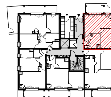
Plan de repérage (sans échelle)