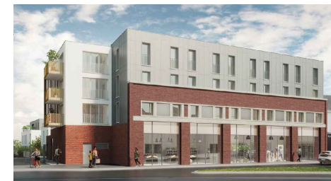
CONSTRUCTION DE 76 LOGEMENTS COLLECTIFS 25 rue de Paris, 80000 AMIENS