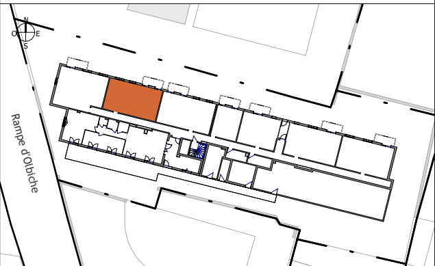
TABLEAU DES SURFACES (compris placards)