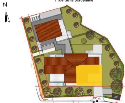
villa ZURIA 1 rue de la porcelaine