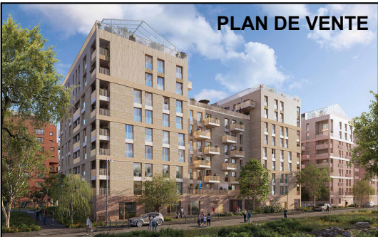
PLAN DE VENTE