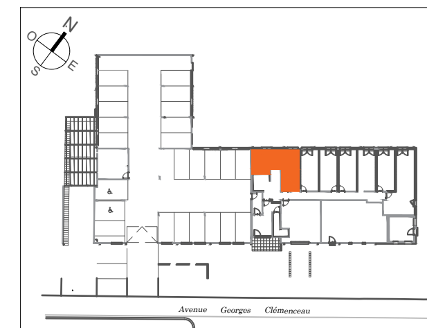
TABLEAU DES SURFACES (y compris placard)

104-110 Avenue Georges Clémenceau 45 140 Saint-Jean-de-la-Ruelle Appartement 1 PIECE Lot n°001 REZ-DE-CHAUSSEE