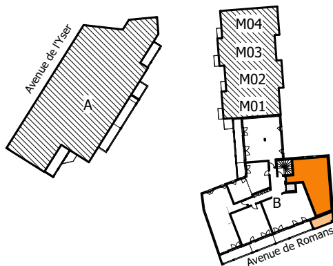
TABLEAU DES SURFACES (compris placards)