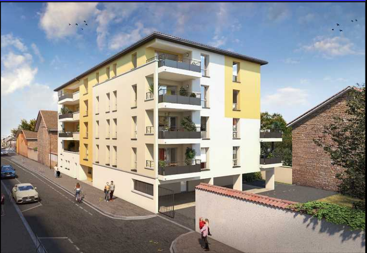
URBAT PROMOTION - Immeuble OXYGENE - 1401, Avenue du mondial 98 CS 68214 - 34965 Montpellier cedex 2