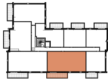
TABLEAU DES SURFACES (compris placard)

40 Boulevard d'Armor 35260 Cancale Appartement 4 pièces Lot n° A205 2ème ETAGE- COMBLES