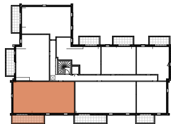
TABLEAU DES SURFACES (compris placard)

40 Boulevard d'Armor 35260 Cancale Appartement 4 pièces Lot n° A206 2ème ETAGE- COMBLES