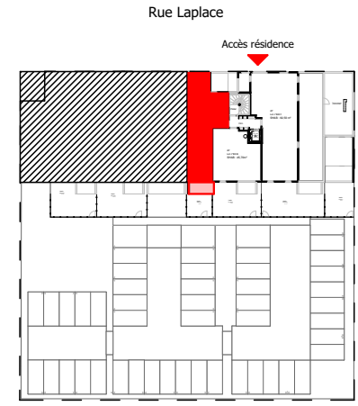
Tableau des surfaces (compris placards)