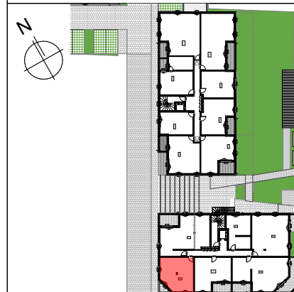
TABLEAU DE SURFACES (compris placards)