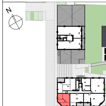
TABLEAU DE SURFACES (compris placards)

217-219 Rue Emile Normandin 17000 La Rochelle APPARTEMENT 2 PIECES LOT n° 306 BÂTIMENT A