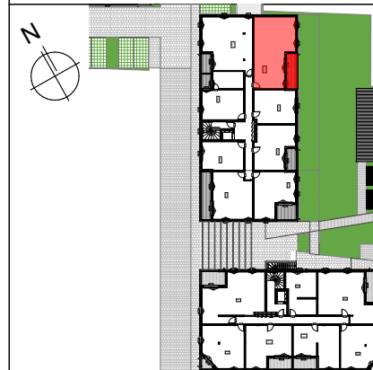
TABLEAU DE SURFACES (compris placards)

217-219 Rue Emile Normandin 17000 La Rochelle APPARTEMENT 3 PIECES LOT n° 103 BÂTIMENT B