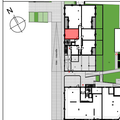
TABLEAU DE SURFACES (compris placards)

217-219 Rue Emile Normandin 17000 La Rochelle APPARTEMENT 1 PIECE LOT n° 001 BÂTIMENT B